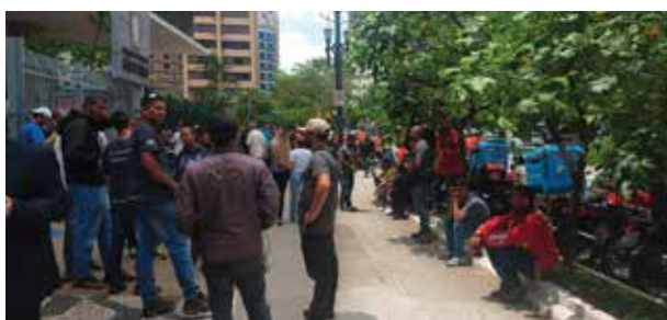
Entregadores comparecem em peso mostrando união e determinação para aprovação do PL 578.

Se aprovado na Câmara dos Vereadores de SP, os entregadores terão melhorias no exercício da profissão e, de cara, aumento de 30% no valor das entregas por conta do adicional de periculosidade, seguro de vida, cobertura hospitalar em caso de acidentes, entre outros direitos. Já as empresas de apps, serão obrigadas a serem responsáveis solidariamente com seus cola-