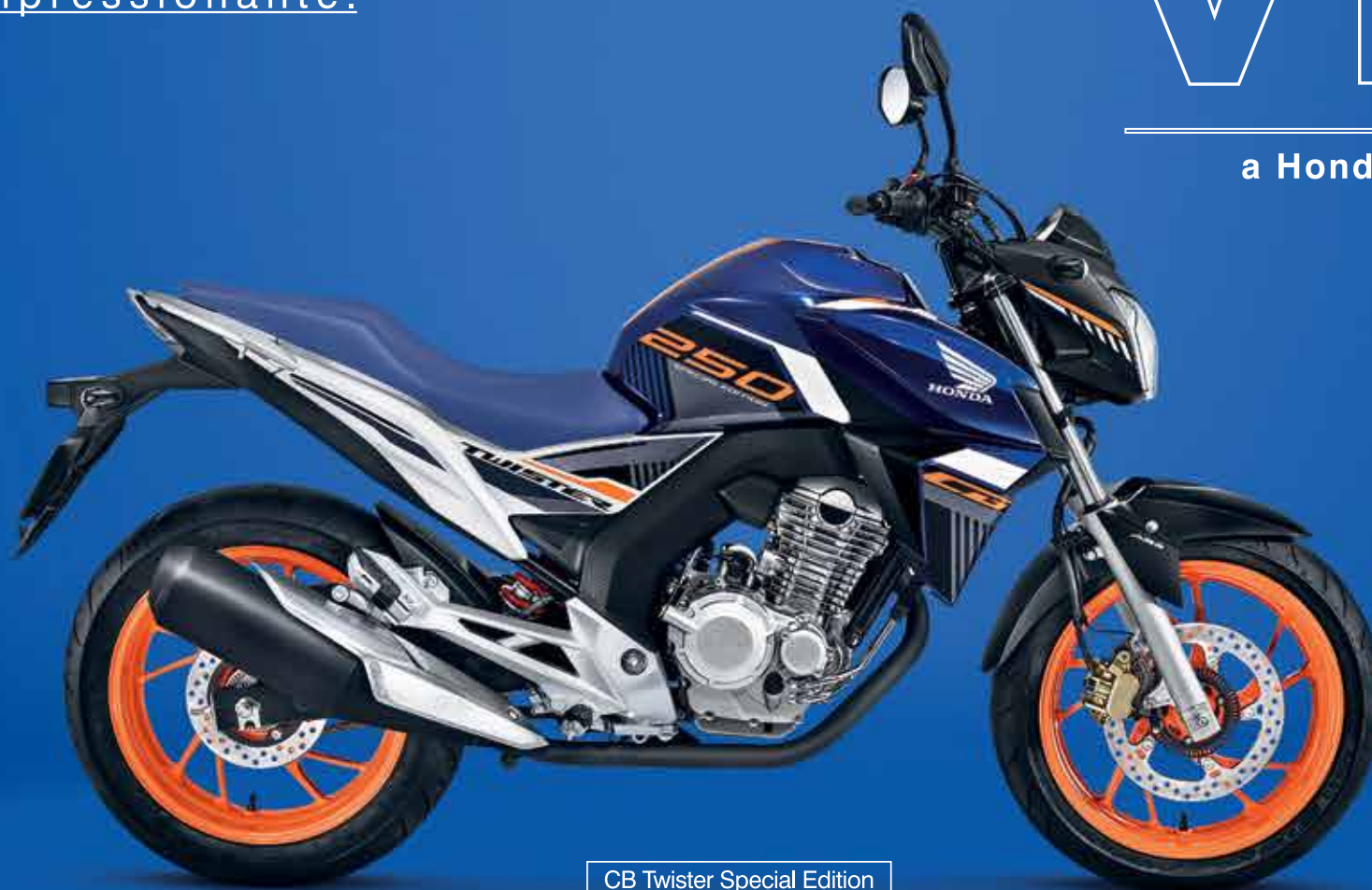
CB Twister Special Edition

3 ANOS DE GARANTIA + 7 meses de garantia extra*