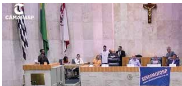
Presidente Gil discursa a favor dos entregadores e defende PL 578 que beneficia categoria.

Importante avanço nos direitos dos entregadores, projeto é divisor de águas porque moderniza Lei Municipal 14.491 e atende determinações das leis federais que já existem e disciplinam setor de motofrete